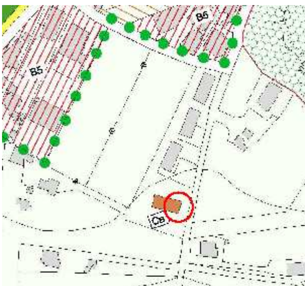
P.R.G. adottato 2013

Descrizione: Appartamento a piano terra di mq. 79,00 con pertinenza esterna di mq. 298,00;